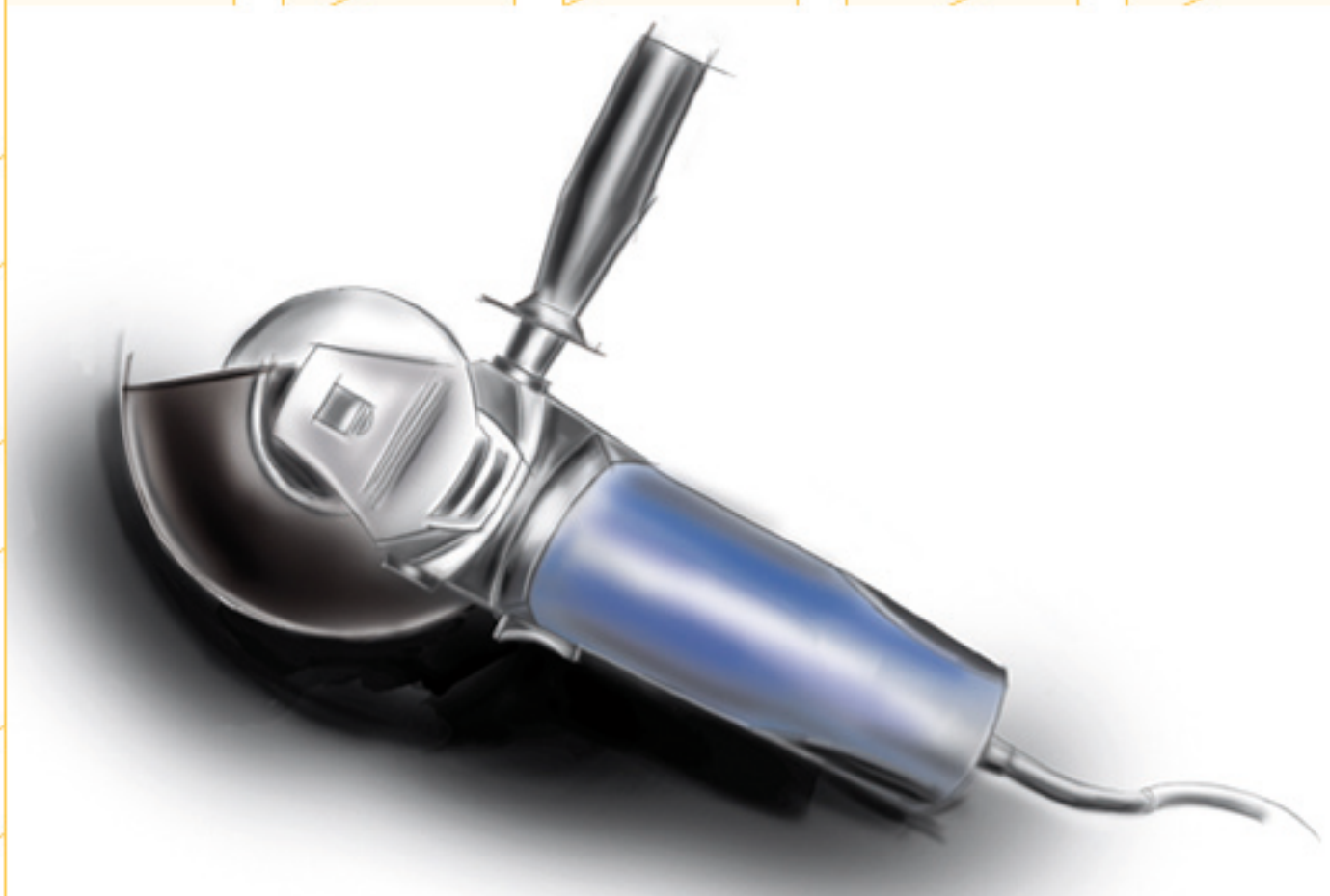
bruska / kresba na tabletu / 2008