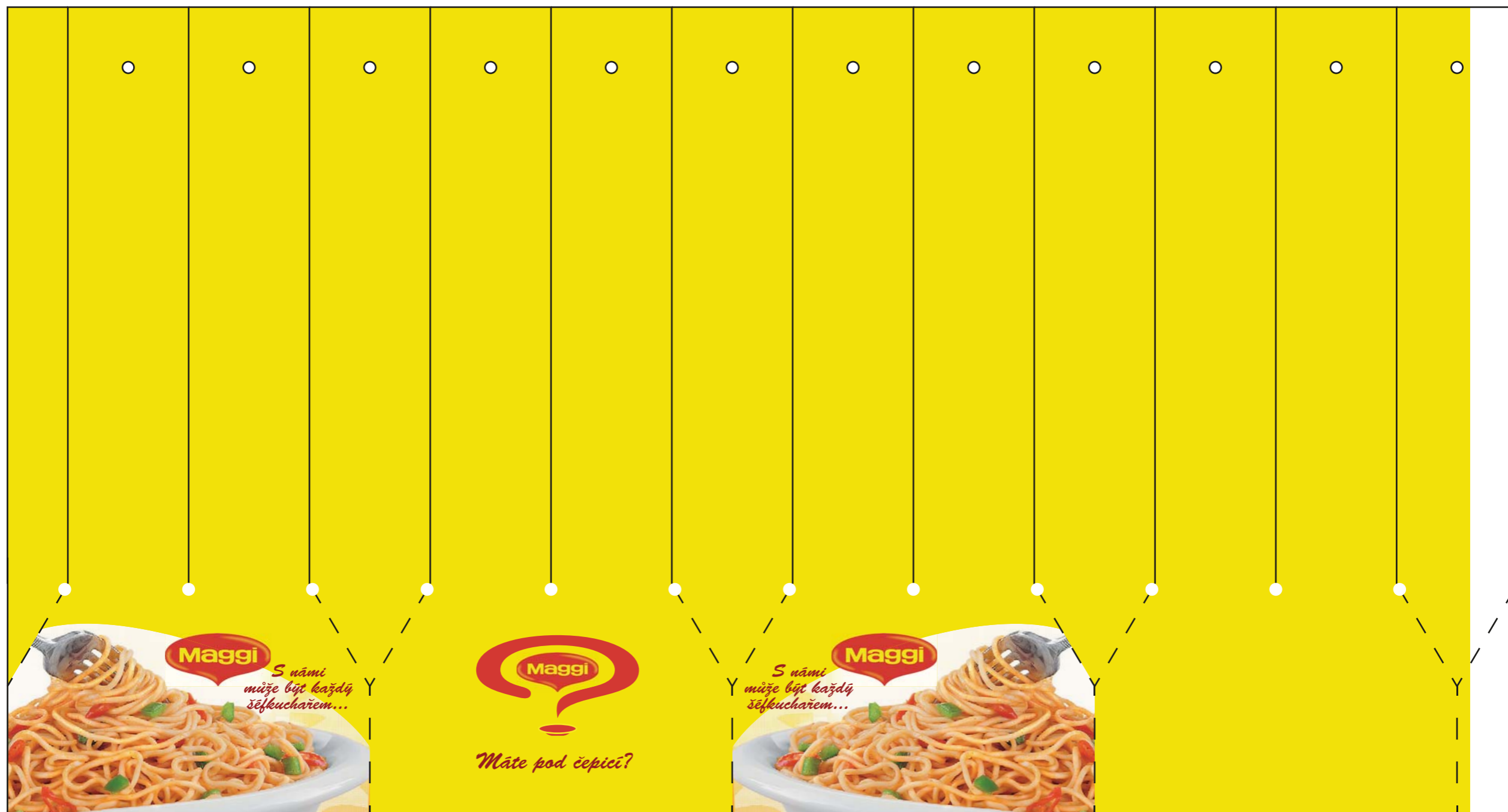
Potisk bioplastové čepice na stojan