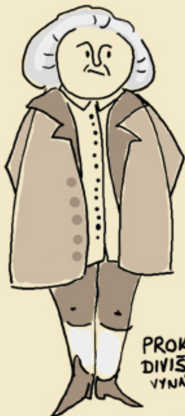
PROKOP DIVIŠ (1693-1765) VYNÁLEZCE