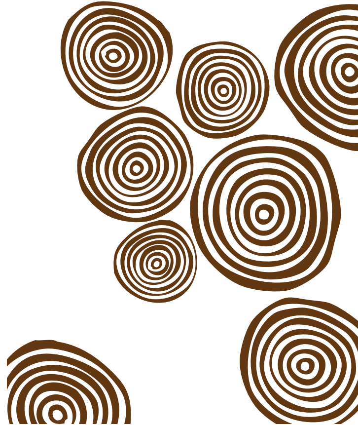
VEGETABLES ON THE BOARD