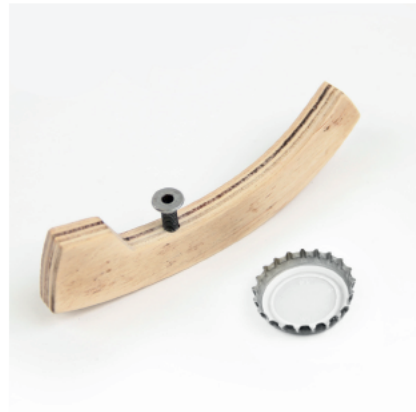
Michal Jakubec recyklovaný otvírák na laňve