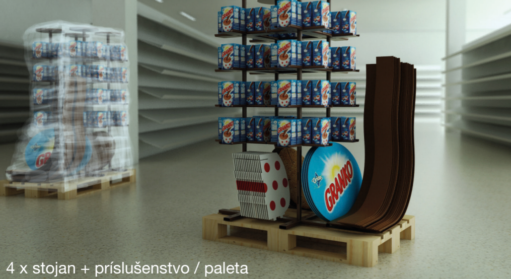
4 x stojan + príslušenstvo / paleta