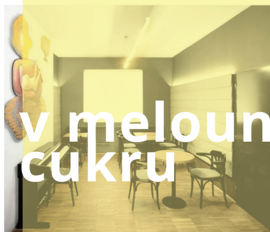
mezzanine v melounovém cukru