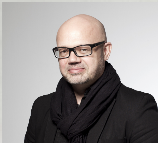
Text: Ondřej Krynek

“Jedná se o vůbec první velkou retrospektivní výstavu Ronyho Plesla. Její myšlenkou je seznámit veřejnost s dokonalým řemeslným zpracováním a ojedinělým pohledem na současné české sklo, kde se autor nebrání kombinaci různorodých materiálů a neotřelých forem s velkým respektem k historickému kontextu,” dodává.