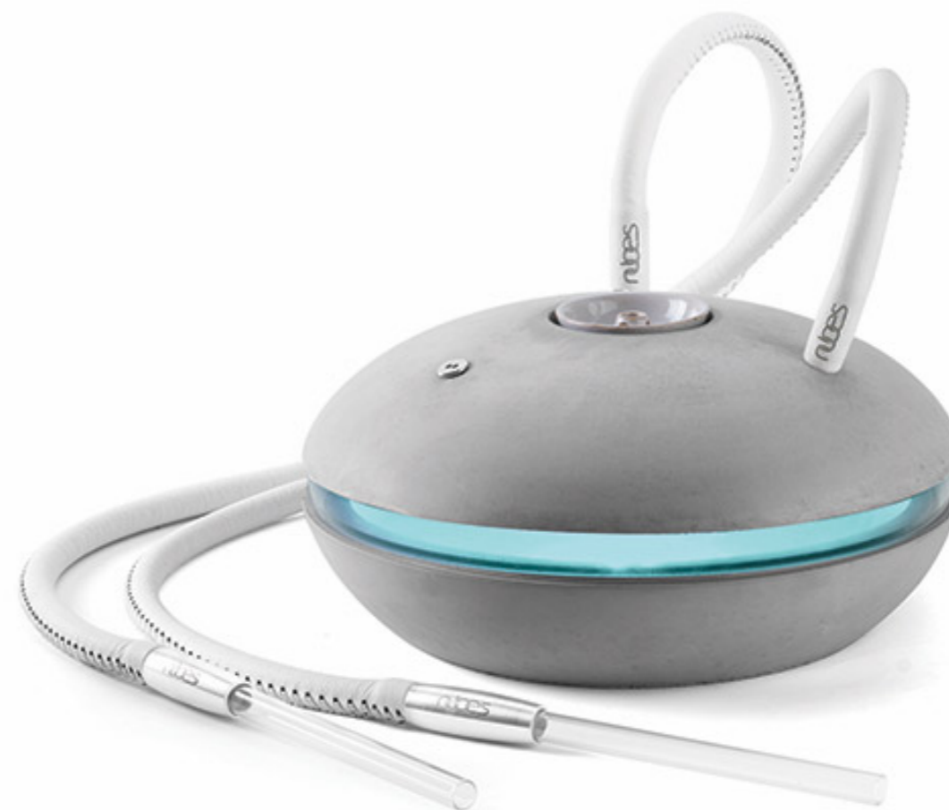
Text: Ondřej Krynek Foto: Nubes Pipes Zdroj: Prague Design Week

Prague Design Week 2016 zaujal do 8. května 2016 čtyři patra Kafkova domu, kde se představí více jak 90 designérů, módních návrhářů, šperkařů, řemeslníků, výtvarníků, škol, designérských studií i výrobců. Doprovodným programem budou workshopy, každodenní přednášky a již tradiční Design Kino.