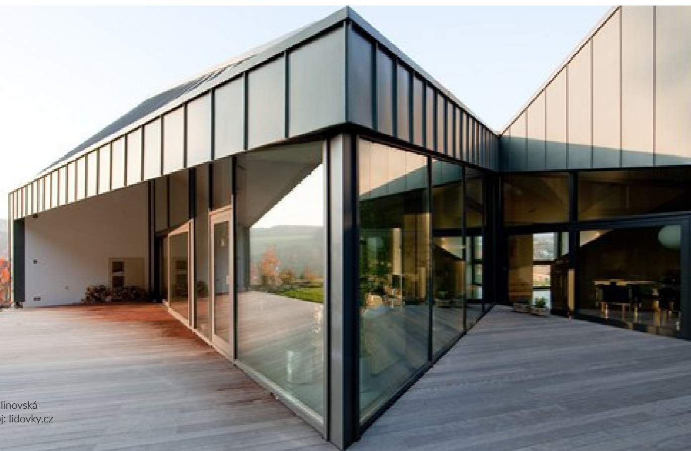
Text: Eva Hlinovská

Na pražský Libeňský ostrov, kde v přízemním ateliéru sídlí studio olgoj Chorchoj, přijíždí na své čezetě. Nakrmí tři kočky a připraví kávu. Do studia se pomalu scházejí mladí architekti – zakázky z architektury totiž dnes tvoří většinu práce olgoj Chorchoj.