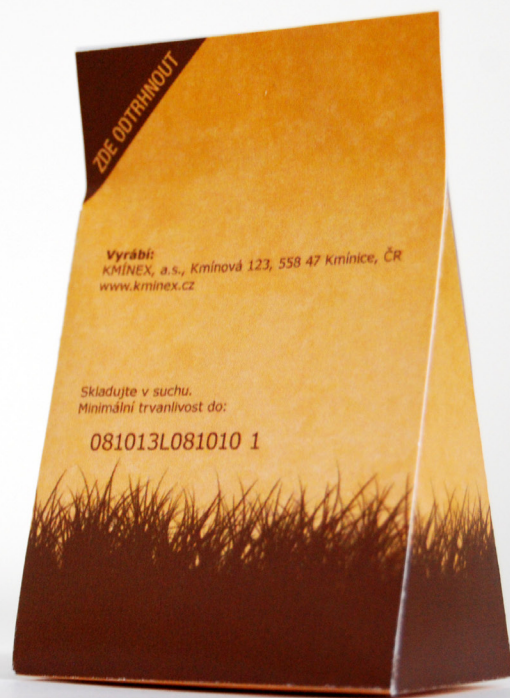
Jakub Hájek / Ústav vizuální tvorby / 5. ročník