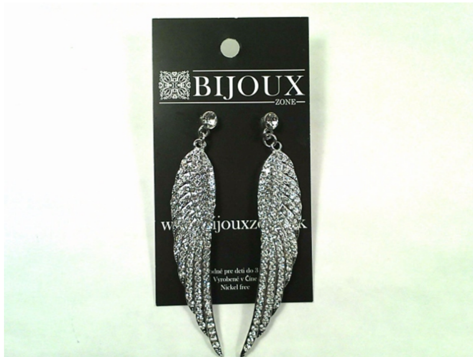
Súčasný obal na bižutériu