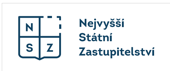
Aplikace na bílé pozadí