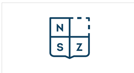
Aplikace na bílé pozadí