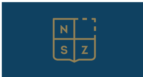
Aplikace na tmavé pozadí