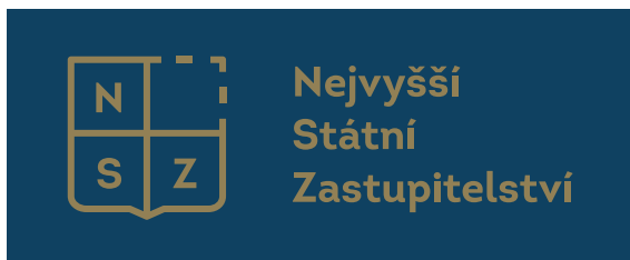
Aplikace na tmavé pozadí