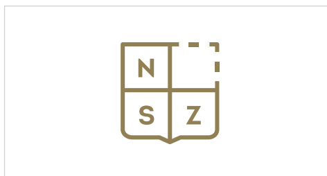
Aplikace na bílé pozadí