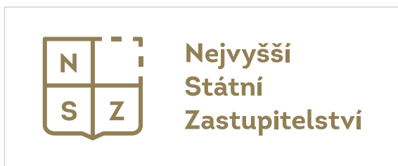
Aplikace na bílé pozadí