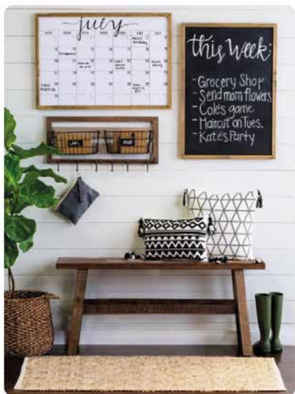
nezabudnite na plány