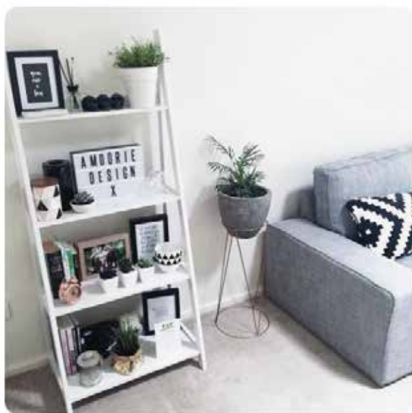
ako si skrášlit' poličku