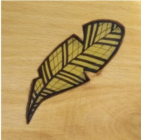
Živica + grafika