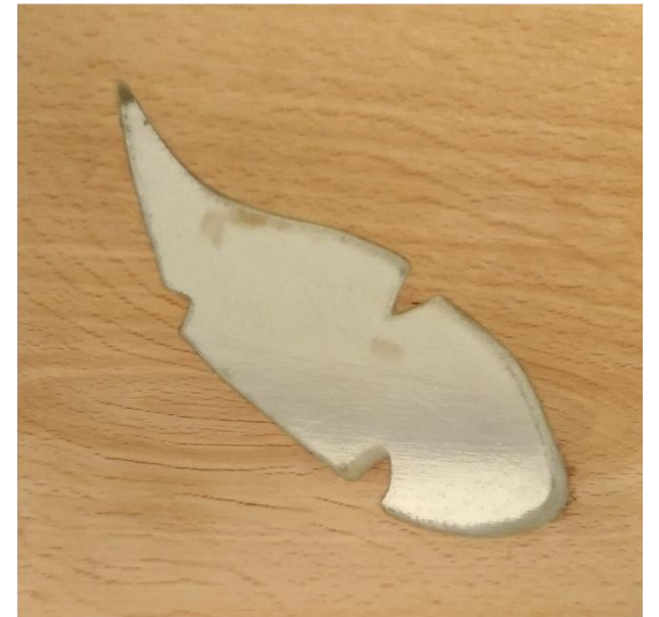
Živica + fosforeskujúca farba