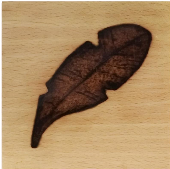
Živica + vypaľovanie