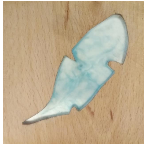
Živica + farba