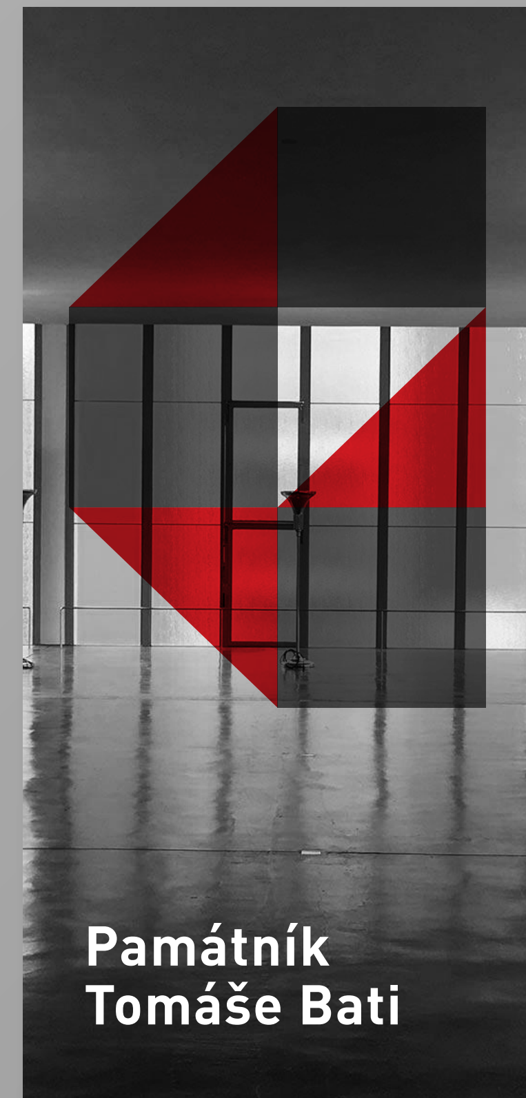
Památník Tomáše Bati