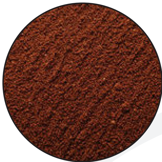
kávo á sedlina