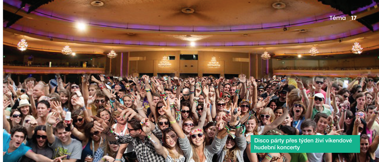
Disco párty přes týden živí víkendové hudební koncerty

A když se to stane, jeho mozek prostě odmítne takovou informaci zpracovat a tak jí vypustí. Jestli si každopádně někdo tenhle můj taneček před rentgenem natočil na bezpečnostní kameru, mám už stoprocentně poldy v zádech. První odhození jedné z mnoha vrs-