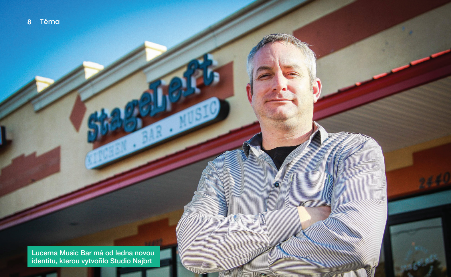
Lucerna Music Bar má od ledna novou identitu, kterou vytvořilo Studio Najbrt