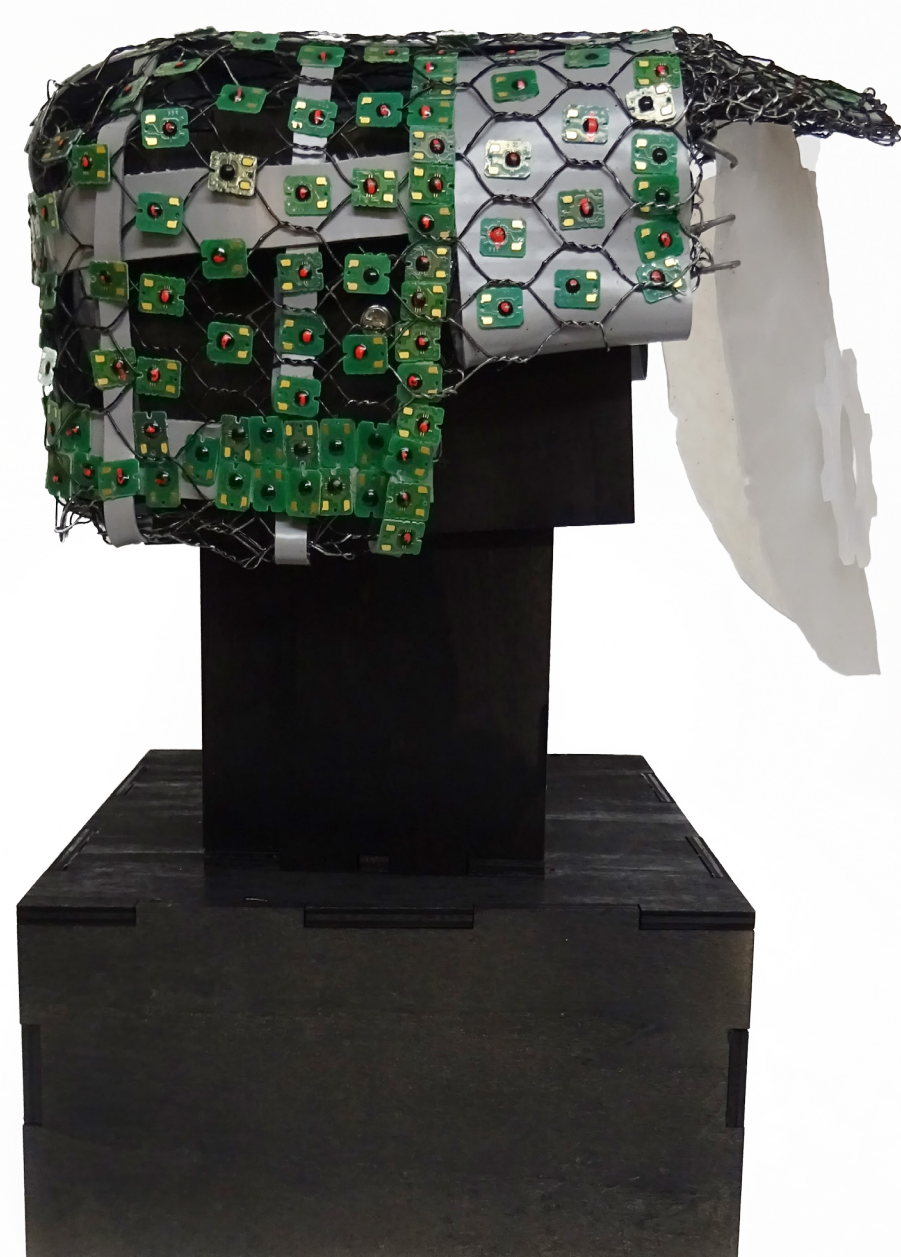
POHLED Z BOKU