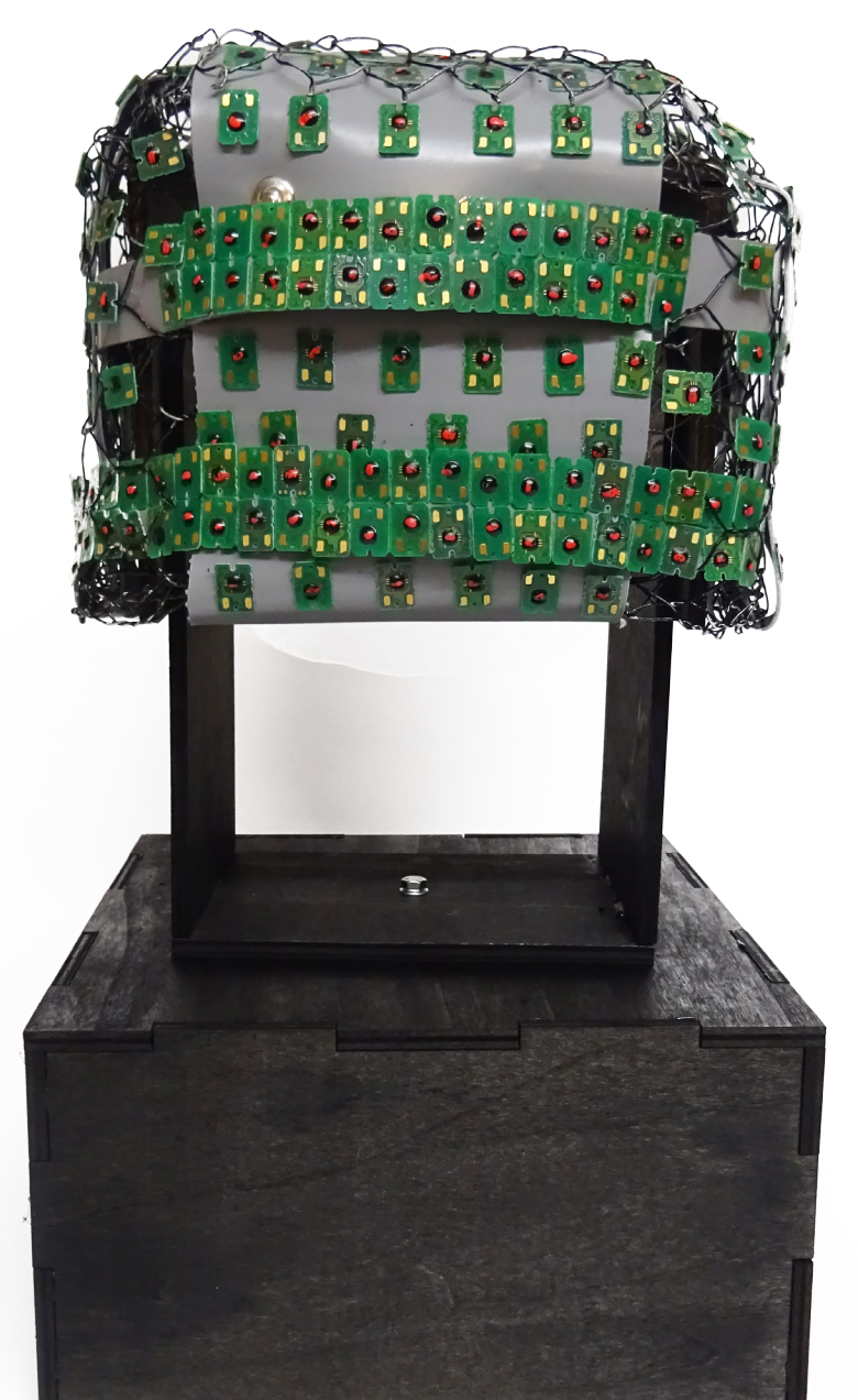
POHLED ZE ZADU