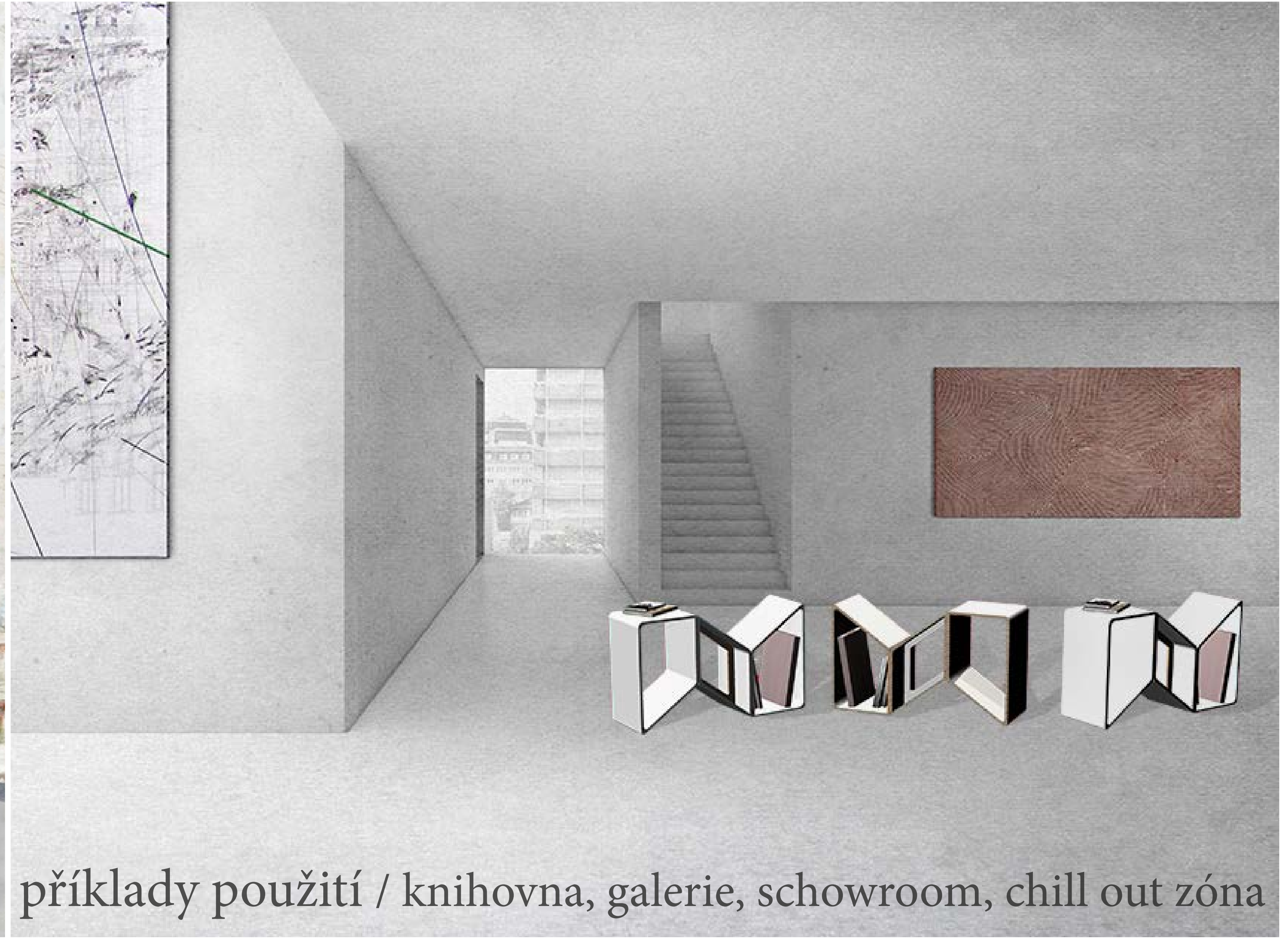
příklady použití / knihovna, galerie, schowroom, chill out zóna