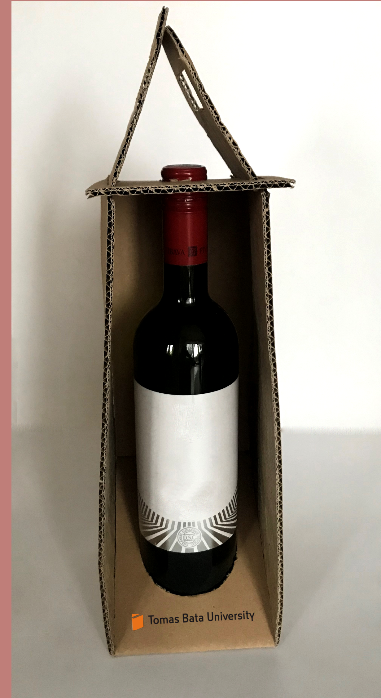
Nikola Valová, ADE, 2. ročník